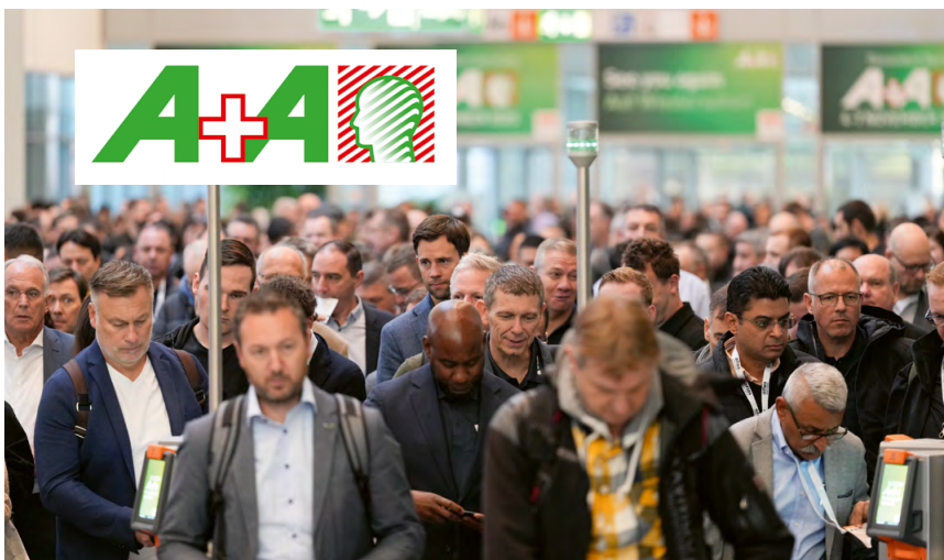
62.000 Menschen aus 140 Ländern besuchten Düsseldorf zur A+A, darunter die Gäste für den Tag der Sicherheitsbeauftragten.

Wie läuft es eigentlich so als Sicherheitsbeauftragte (SiBe)? Gelegenheit zum Austausch darüber gab der „Tag der Sicherheitsbeauftragten“ auf der „A+A Internationalen Fachmesse und Kongress für sicheres und gesundes Arbeiten“. Dort ging es um die Unterstützung, die SiBe sich im Arbeitsalltag für ihr Ehrenamt wünschen.